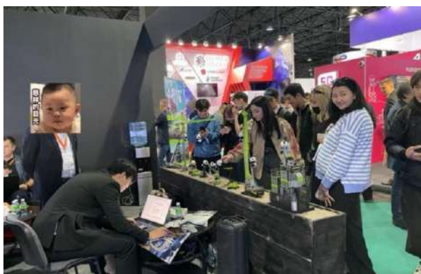
看看这些人，哪儿有一个是买设备的

这里还要放出JMC的壮举，听说我们在中联做了个“熊猫趴竹”的奇观，JMC的大哥问我要走7只小熊猫，美其名曰“七上八下”，大张旗鼓的把吊机臂放下来，愣是