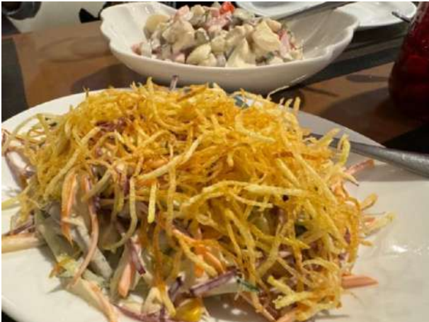
美味的土豆丝沙拉

阿拉木图很好吃，展团安排的几家本地菜、中国菜、格鲁吉亚菜都很不错，土豆丝沙拉尤得我喜爱，就是老这么吃三高风险太高。中国菜比在俄罗斯展团领略的不知强了多少倍，不可比不可比。