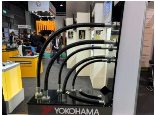
哈喽？有人能体会到我们的兴奋吗？

我再次“洗脑”：“记住，我们是要为客户的痛点提供解决方案，不是要销售我们的产品，我们是平等的，如果有人对我们嗤之以鼻（我俩背着熊猫到处跟人聊天真有点像学校门口卖课的销售），那是他们的损失。”于是，我俩不停的拿下中国展商（的联系方式），但还是没有获取到关于哈萨克斯坦本地有用的市场信息。我俩窝在休息区整理思路，赫然发现休息区对面赫然摆放着竞品。