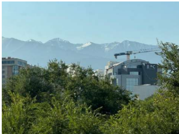
酒店走廊远眺的雪山

9月15日下午6点多从北京大兴起飞,阿拉木图当地时间9点多钟到达,看起来好像只有3个小时路程,实际上加上3个小时的时差,航程6个小时左右,一路无眠。哈萨克斯坦对中国护照采取落地签政策,持有护照即可入境,入境的过程很顺利,海关的小哥也很帅。出了机场的门一眼看到华为的标识,民族自豪感油然而生。路上非常黑,路灯少,想想和国内的反差,默默在心里给中国基建竖个大拇指。