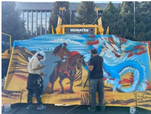
小松工作人员正在工作

阿拉木图是一个随处可见雪山的城市,一个是因为的确被雪山环抱,另一个则是因为高楼相对较少,视野相对开阔。