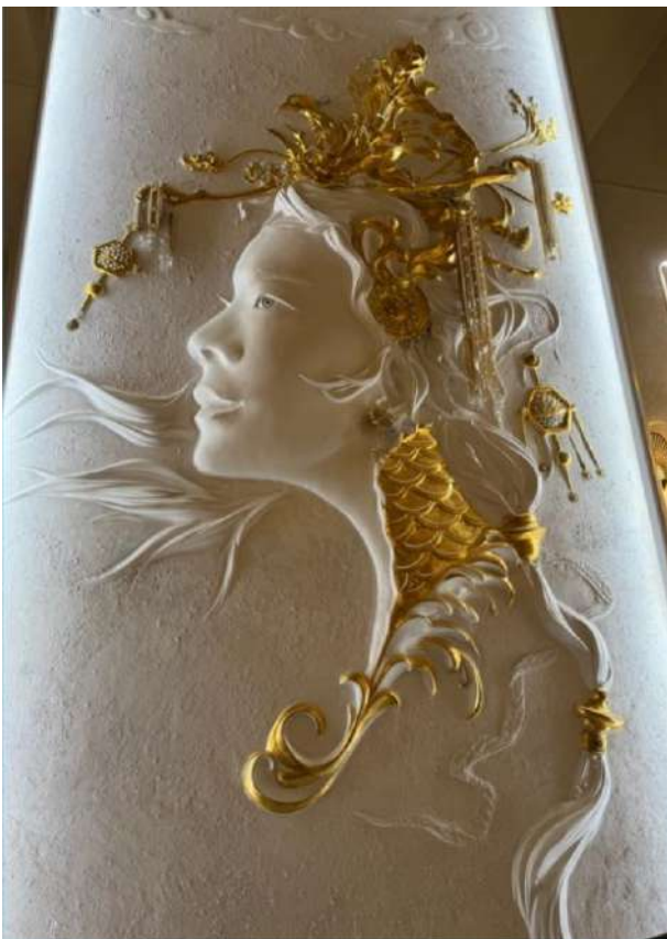
中国餐厅墙上绘制的“中国公主”