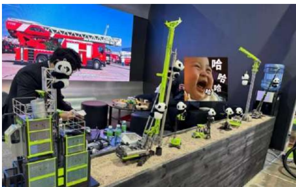
请欣赏熊猫趴竹子

然而一个大BOSS长相的人物看到我们，起身和我们交谈（这是第二天早上，还没开展，观众没入场），我们自然先亮明身份，“我们在国内是中联的合作伙伴，看到你们倍感亲切”之类的云云，双方寒暄一下顺便谈谈本地售后市场的情况，大BOSS看起来严肃，但是非常直率，提供信息也不藏着掖着，直说中联售后用的不多，怪打击人的（开玩笑，说明中联产品质量好）。然后事情开始走向不可控制的场面，我俩掏出小熊猫送给BOSS，中联的同志多，刚好我俩的熊猫多，我招呼着给同志们发小熊猫，中联的同志们张罗着给我送塔吊小模型，不知哪位天才，把小熊猫挂在塔吊上，妙啊！小熊猫配上中联绿，妥妥的熊猫配竹子，我不断往外掏小熊猫，终于把中联所有模型都给摆满了，可爱非凡，气氛一下子变得欢乐起来，真是意外之喜，小熊猫啊小熊猫，不亏姐姐妹们不远万里把你背来。